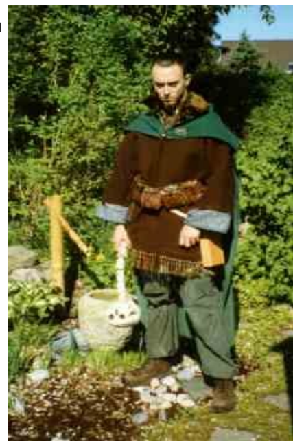
plejl af kranie i rygrad

usk at hvis det går helt galt for dig, kan du så købe din Morgenstjerne af en af nomerne her i værkstedet for 450kr