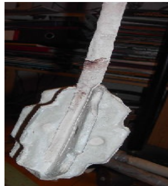
Billeder af et plejl hoved der får latex og stof